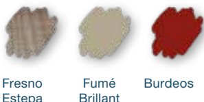
Fresno Estepa Fumé Brillant Burdeos