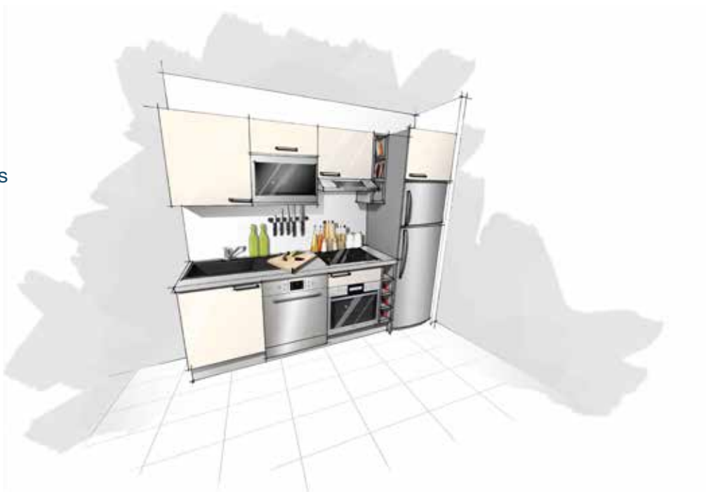
Exemple d'aménagement d'une cuisine pour appartement 3 pièces (2)