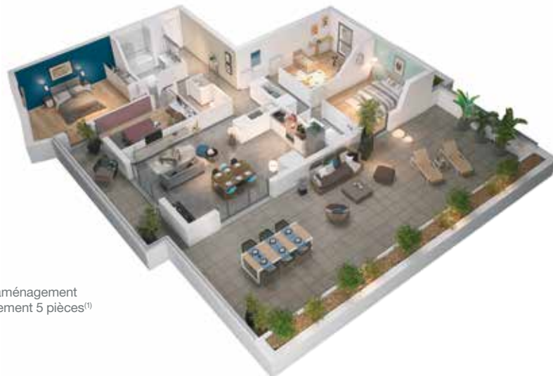
Exemple d'aménagement d'un appartement 5 pièces (1)

La plupart des logements sont prolongés par des loggias ou balcons tandis que d'autres offrent de somptueuses terrasses en attique ; un espace de vie supplémentaire lors des beaux jours.