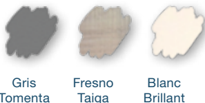
Gris Tomenta Fresno Taiga Blanc Brillant

Personnalisez votre cuisine avec 6 finitions au choix pour les façades