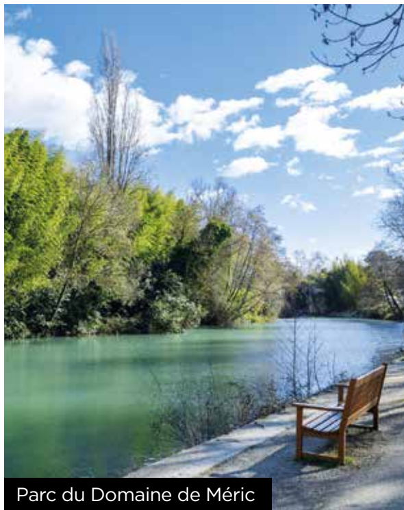
Parc du Domaine de Méric