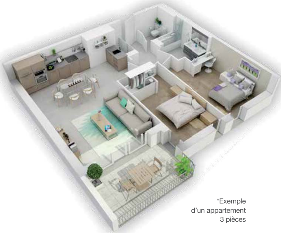
*Exemple d'un appartement 3 pièces