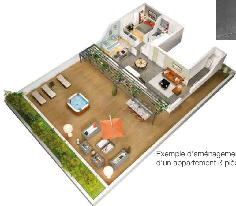
Exemple d'aménagement d'un appartement 3 pièces (1)