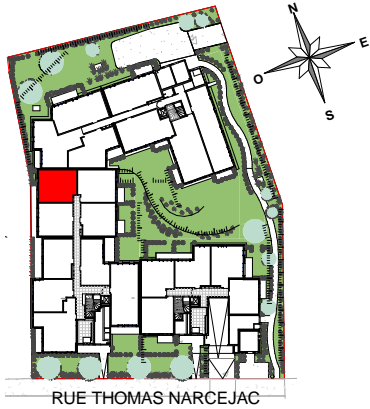
RUE THOMAS NARCEJAC